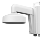
DS-1272ZJ-110B Настенный кронштейн