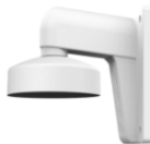
DS-1272ZJ-110 Настенный кронштейн