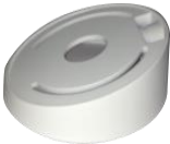
DS-1259ZJ Потолочное крепление